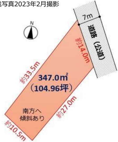
※地籍測量図を基に作成しています。 図面と現況が異なる場合は、現況優先になります。